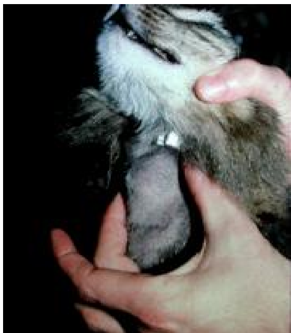
Figura 2. Metoda de palpate a glandei tiroide la pisică [22].

Există și situații în care datorită dezvoltării excesive, masa tiroidiană hiperplaziată să migreze ventral spre intrarea pieptului, în mediastinul cranial [5].