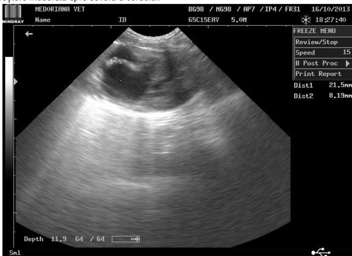
Figura 3. Ultrasonografie se observă hipertrofia ventriculului stâng cu îngustarea spațiului ventricular (original, Pap).

Examinarea funcției cardiace este foarte importantă, în special datorită faptului că aceasta este frecvent asociată cu insuficiența cardiacă congestivă și mai puțin cu cardiomiopatia dilatativă [11].