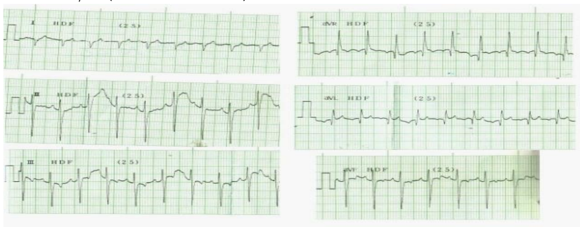
Figura 5. Electro-cardiograma cu bloc total de ramură dreaptă și bloc atrio-ventricular de gradul I și ischemie subendocardică (original, Pap)

Totuși în ultimele studii, aceste alterări au o prevalență mai mică, dar crește cea a blocării ramurii drepte a fasciculului His (figura 5). [4, 10, 11].