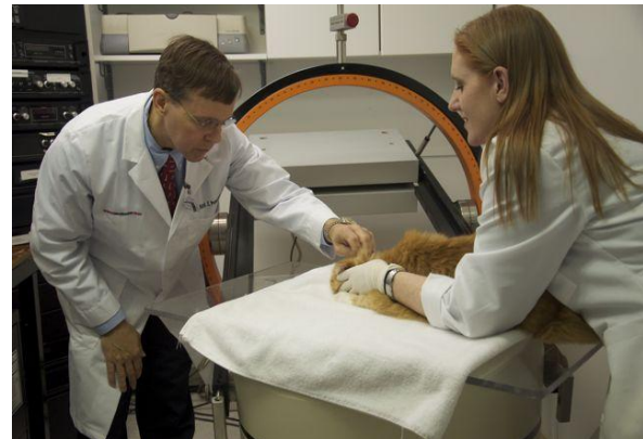
Figura 6. Poziționarea ventrală a pisicii în vederea scintigrafiei (Clinica Hipurrcat) [20]

camera gamma formează imaginea. Aceasta nu necesită anestezia pacientului [6, 20].