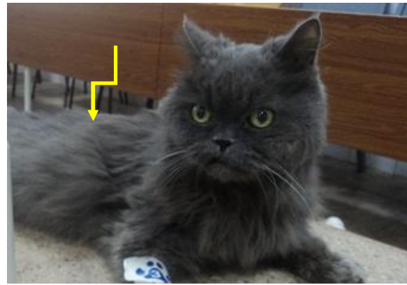
Figura 1. Aspectul murdar al părului la o pisică cu hipertiroidism (original, Pap)

Proprietarii mai pot observa și modificări comportamentale, reprezentate de hiperactivitate, neliniște, chiar agresivitate față de stăpâni sau alte animale din același mediu. Foarte rar (10%) se poate observa o stare de apatie sau de nepăsare față de activitățile din jur, depresie, inapetență și slăbiciune, caracteristică unei forme de hipertiroidism aparte numită hipertiroidismul apatic. Se mai pot observa modificări ale tractului gastro-intestinal traduse printr-o frecvență crescută a vomitării și a diareei, precum și creșterea cantității de fecale, datorită polifagiei. Vor apare modificări și la nivelul blănii, părul având un aspect murdar și aspru [4, 5, 17].