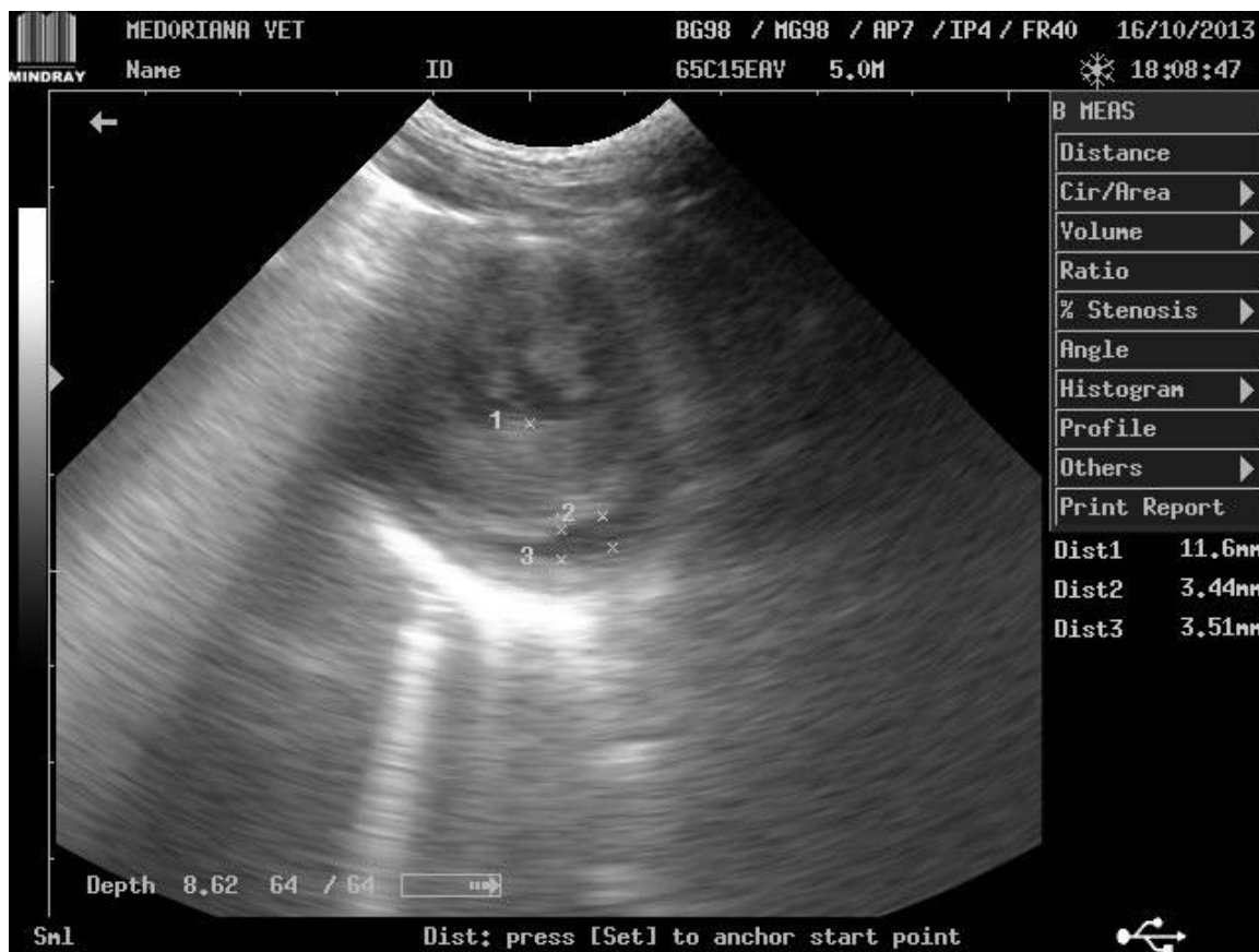
Figura 4. Ultrasonografie, se observă hipertrofia septului interventricular cu reducerea camerei ventriculare (original, Pap)